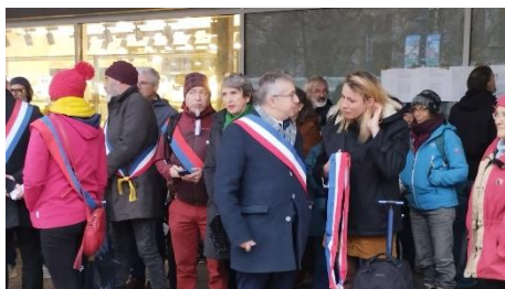
2 Manifestation du 5 décembre

Une manifestation (le "Train de la Colère") rassemblant des élus (dont un sénateur de l'Isère et le maire de Veynes), des usagers et des représentants des usagers (dont Mobil'idées) a eu lieu à Grenoble le 5 décembre pour demander que la régularité de la desserte soit rétablie. Le collectif a demandé que, dans le cadre de la renégociation de la convention entre la région AURA et la SNCF dont la signature a lieu le 15 décembre, les conditions de malus plus incitatives soient contractualisées. Le collectif a par ailleurs demandé à la Région AURA d'indemniser les usagers pour les déboires rencontrés et de relancer la fréquentation, impactée de manière significative par les incidents répétés, en pratiquant une réduction tarifaire durant le premier trimestre 2024.