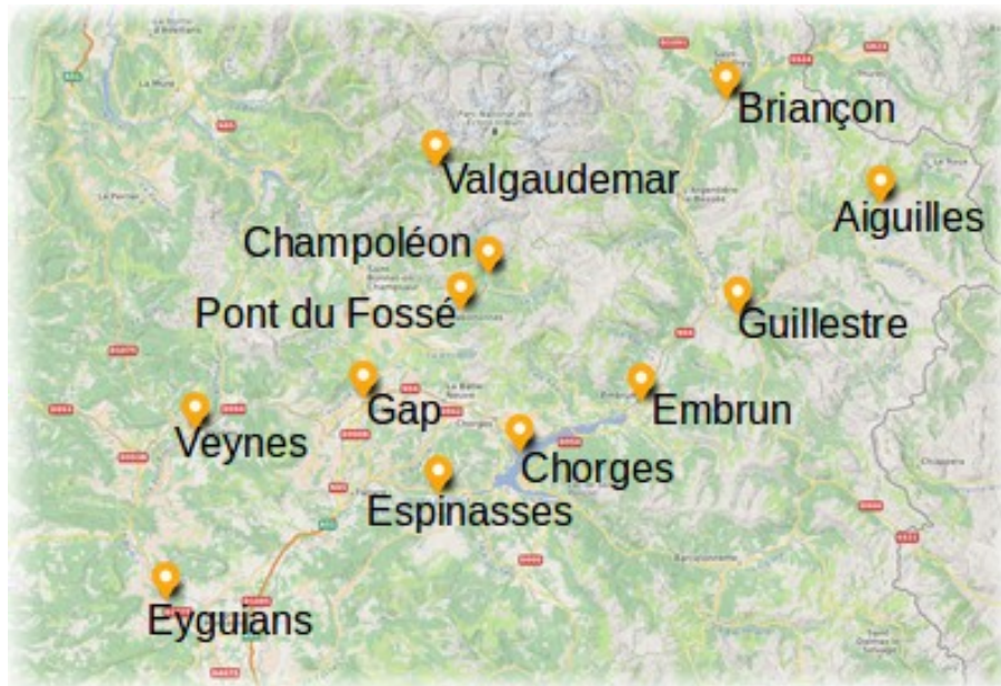
Carte de la participation de Mobil'idées à des événements

Mobil'idées participe à des événements grand public, toujours en partenariat avec d'autres structures locales et en offrant des animations et des outils de sensibilisation.